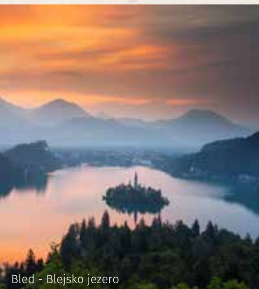
Bled - Blejsko jezero

Benetke, Marco Polo 190 km (I) Celovec 196 km (A)