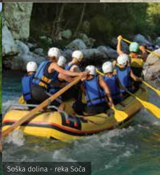
Soška dolina - reka Soča