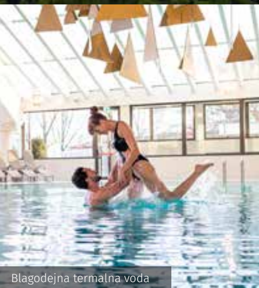
Blagodejna termalna voda