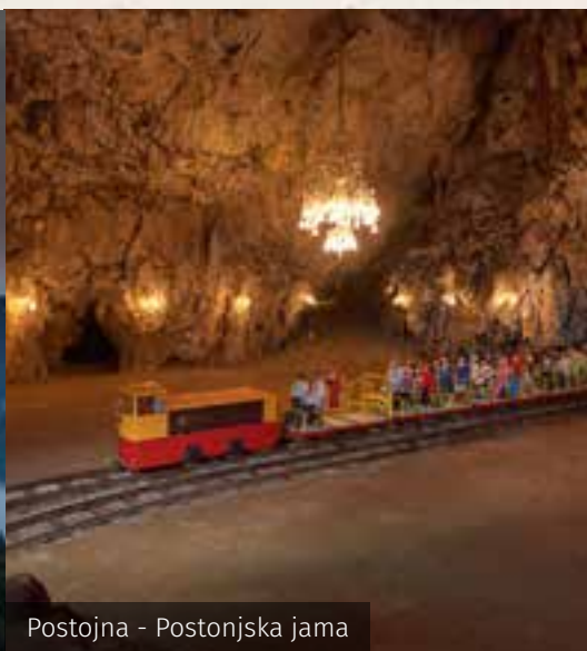
Postojna - Postonjska jama