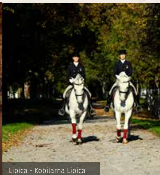
Lipica - Kobilarna Lipica